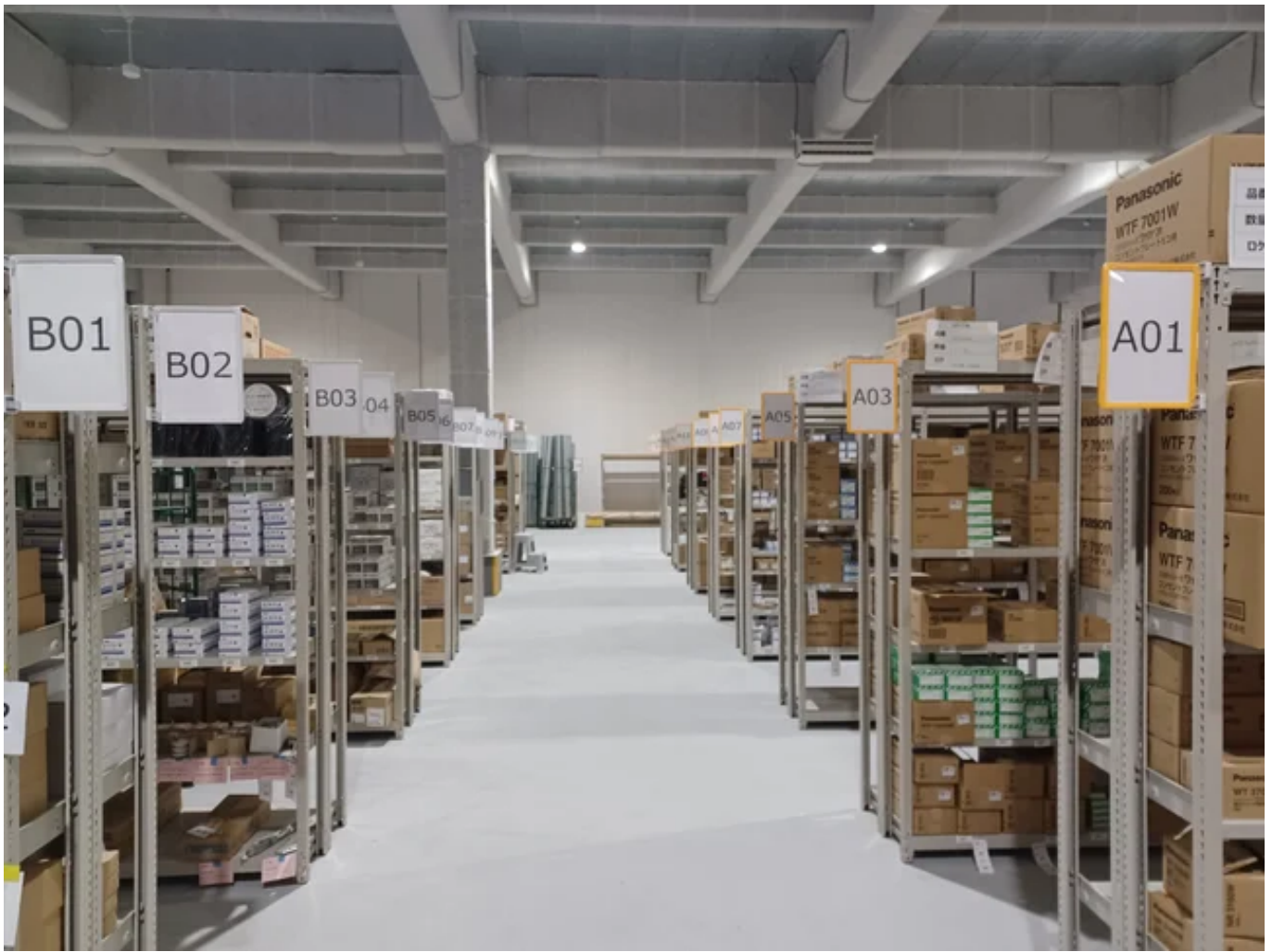
倉庫内の様子（1階床面積65.34坪、4階床面積402.93坪）