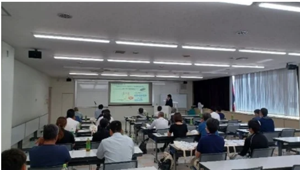
SDGs（持続可能な開発目標）をテーマにした展示とセミナーの様子

特別セミナーでは、業界のスペシャリストによる「ZEB市場の基礎から応用まで」「拡大するリースによる太陽光発電・蓄電池販売」「LED照明器具リニューアル講習会」「小川電機のスマートコネクト事業（ソフトウェア支援、line works、XUSUXコラボ）」について、ご紹介いただき最新情報と知見を共有しました。